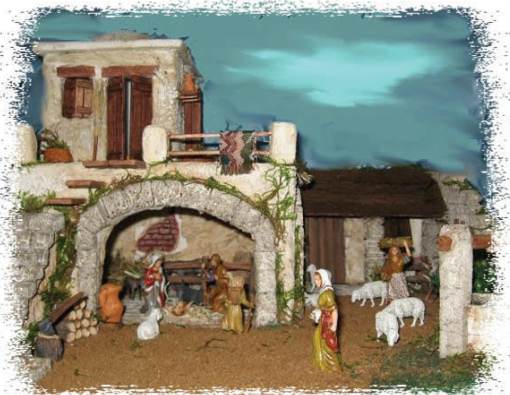
Presepe palestinese realizzato da: Paola Prella e Patrizia Miglio