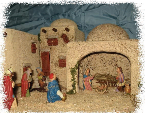
Presepe palestinese realizzato da : Giacomo Bovio e Marino Andrico