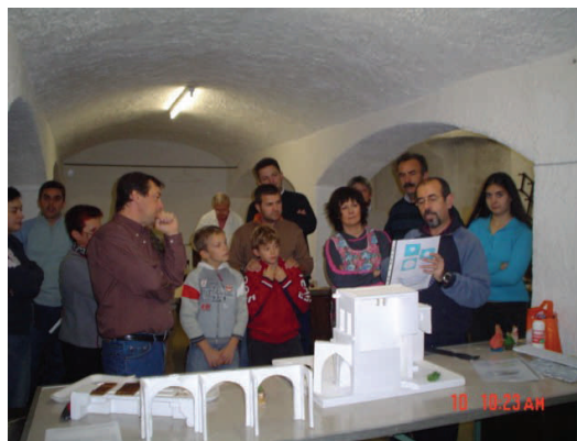
Corso 2007, lezione con il maestro