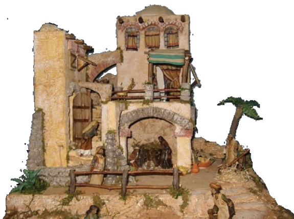
Presepe palestinese realizzato da: Paolo Boggio, Susanna Miglio e Roberto Colombo